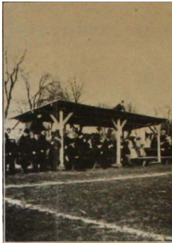
La fameuse première tribune du Parc des Sports

En 1902, on construit une première tribune pour la somme de 200 francs, collectée grâce à une souscription parmi les joueurs qui versèrent chacun 5 francs. L'édifice était alors réservé aux dames et aux membres du comité !