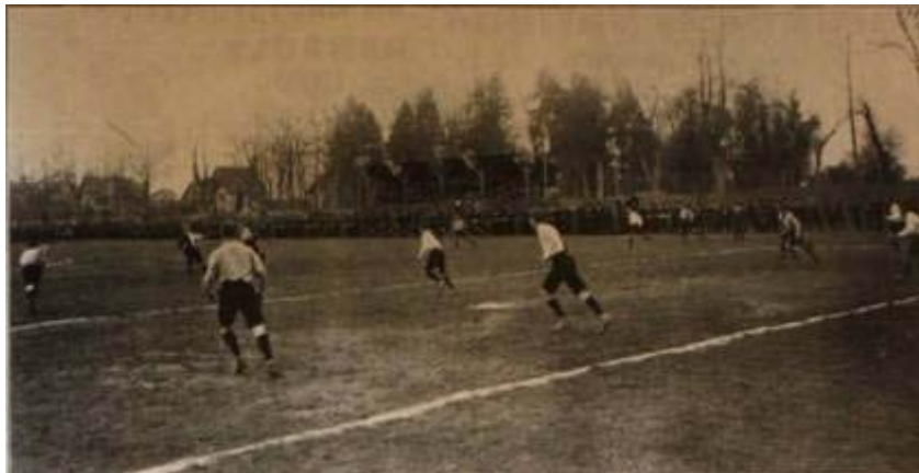
Le premier match à domicile de l'équipe de Suisse (1908)

En 1908, le Parc des Sports est fin prêt pour accueillir son premier match d'équipes nationales (Suisse-France) : une tribune de 200 places a été construite le long de la Rue de Lyon.