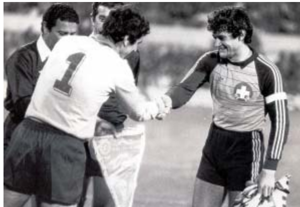
Le 27 octobre 1982 à Rome, victoire 0:1 des Suisses contre les champions du Monde, poignée de mains entre deux gardiens de légende : Dino Zoff et Eric Burgener