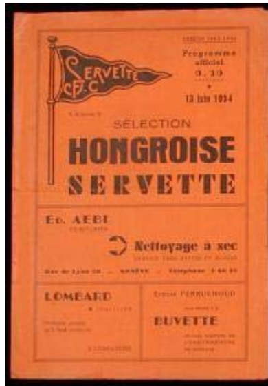
Programme de match 13.6.1954