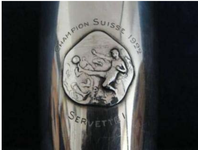
Le trophée de 1922

collections et albums privés), des documents audio, des films et des vidéos (disques, enregistrements radiophoniques, films amateurs) ont ainsi été rassemblés.