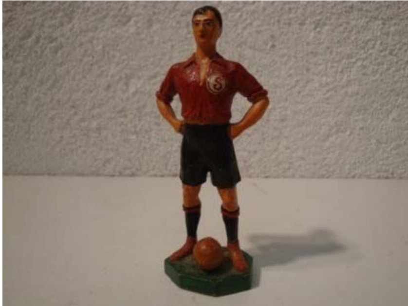
Un fier Servettien, vers 1940 (10,5 cm)