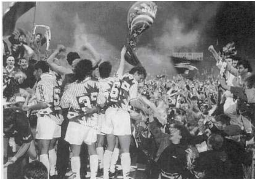
On ne s'en lassera jamais...