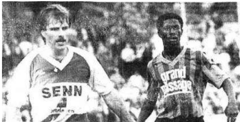
Sous le maillot carougeois contre le leader Granges, (19.05 1985), et un grand magasin genevois, un !