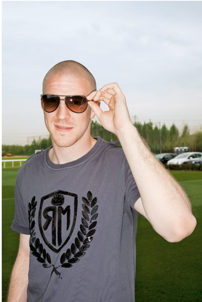
«Ich will nur ein bisschen mehr wissen»: Philippe Senderos auf dem Trainingsgelände von Arsenal.